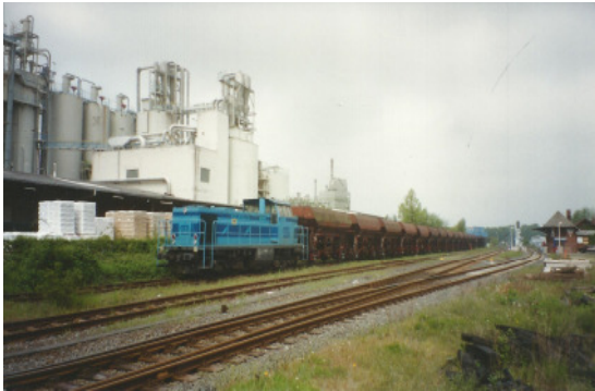
Bf Lendersdorf - AKZO Chemie

wiederrum den Betrieb an die Dürener Kreisbahn (DKB) übertragen wollte. Im 1992 kaufte dann der Kreis Düren die Strecken Jülich – Düren – Heimbach für den symbolischen Betrag von einer Deutschen Mark und übertrug der DKB den Betrieb, der mit dem Fahrplanwechsel 23.05.1993 sichtbar wurde. Begonnen wurde der Bahnbetrieb mit 11 aufgearbeiteten Schienenbussen der Baureihe 798 und 8 Beiwagen in den Farben der DKB. Diese Interimslösung wurde durch die Beschaffung von neu entwickelten Niederflurtriebwagen vom Typ Regio Sprinter, die ab März 1995 zum Einsatz kamen, beendet. Bereits zwei Jahre später stiegen die Fahrgastzahlen gegenüber denen der DB um das 5-fache. Im Weiteren sanierte die DKB die Bahnhöfe und Haltestellen sowie die Strecke und baute moderne Zugsicherungstechnik zur Erhöhung der Sicherheit und zur Beschleunigung des Zugverkehrs ein.