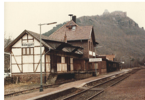
Bf Nideggen-Brück - Burg Nideggen

Mit der voranschreitenden Industrialisierung im 19. Jahrhundert wurde die Kreisstadt Düren schon sehr früh an das Preußische Eisenbahnnetz und damit an die große weite Welt angeschlossen. Drei Jahre nach der Inbetriebnahme der ersten deutschen Eisenbahn von Nürnberg nach Fürth begann man am 01.04.1838 mit dem Bau der Strecke von Köln nach Aachen. Im Jahr 1841 erreichte der Schienenstrang von Köln beginnend Düren. Noch im gleichen Jahr wurde Aachen erreicht und die Strecke in Richtung Belgien weitergebaut. Zur Erschließung des ländlichen Raumes und der Voreifel wuchs schon bald der Wunsch nach weiteren Bahnstrecken. Den Anfang machte die Strecke von Düren nach Euskirchen, die am 01.09.1864 eröffnet wurde. Nur fünf Jahre später wurde Düren mit Neuss verbunden, die - wie die beiden Bahnlinien zuvor - von der Rheinischen Eisenbahngesellschaft errichtet und betrieben wurden. Am 01.10.1873 wurde die Strecke nach Jülich eröffnet. Betreiber dieser Bahn war die Bergisch-Märkische Eisenbahngesellschaft. Nicht zuletzt führte der Umstand zweier Bahngesellschaften mit zwei Bahnhöfen zum Bau eines neuen Bahnhofs in Düren, der mit seiner Insellage noch heute in der ursprünglichen Form existiert.