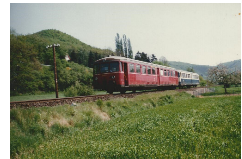
Rurauen bei Zerkall