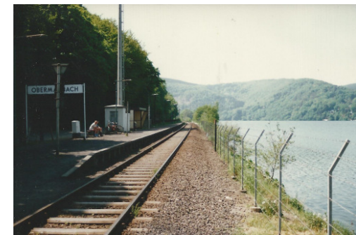
Hp Obermaubach - Stausee