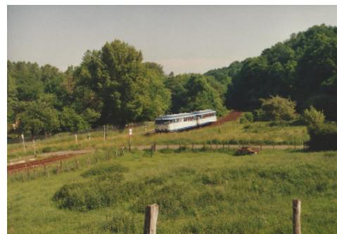
Zwischen Kreuzau und Üdingen