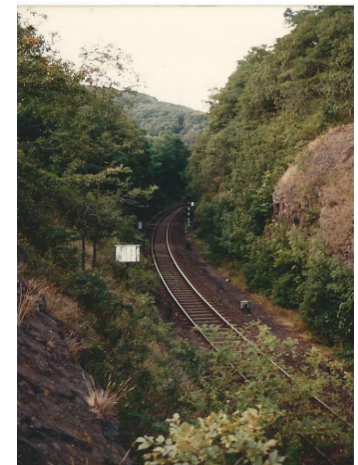
Einschnitt bei Heimbach

Im Zuge des zweiten Weltkrieges und dem erbitterten Kampf an der Westfront wurden zahlreiche Brücken über die Rur und andere Zuflüsse zerstört. Auch die übrigen Bahnanlagen wurden durch Kriegseinwirkungen stark in Mitleidenschaft gezogen. So wurden die Bahnhöfe von Kreuzau und Untermaubach durch Bombentreffen so stark zerstört, dass sie nicht mehr aufgebaut wurden bzw. durch Provisorien und Neubauten ersetzt werden mussten.